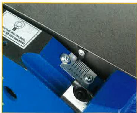
Die Höhenverstellung des Abgabetisches erfolgt seitlich an der Klappachse

Der Maschinengröße angepasst, dreht sich hier eine Welle mit einem Durchmesser von 75 mm, aber immerhin mit drei Messern bestückt, bei einer Drehzahl von 3750 min -1 . Ganz erstaunlich: die geringe Geräuschentwicklung im Betrieb.